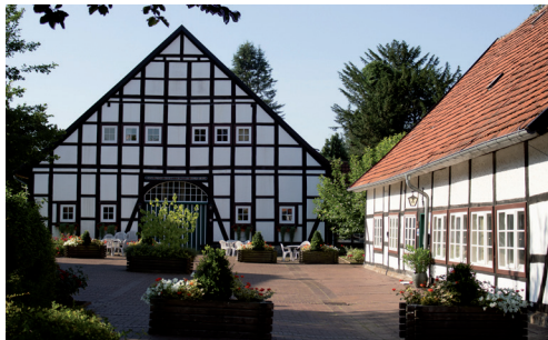
Bückeberg (Landfrauenschule) Jetenburger Straße