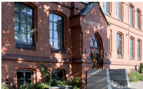
Bückeberg (Marienschule) Am Oberstenhof