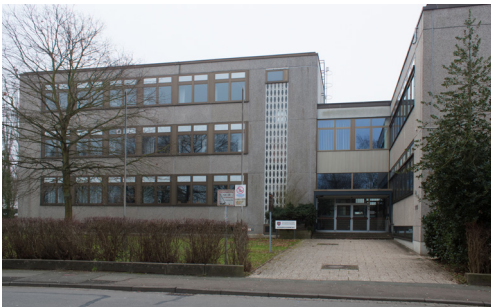
Rinteln (Kreishandelslehranstalt) Dauestraße