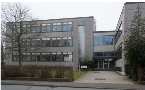
Rinteln (Kreishandelslehr- anstalt) Dauestraße