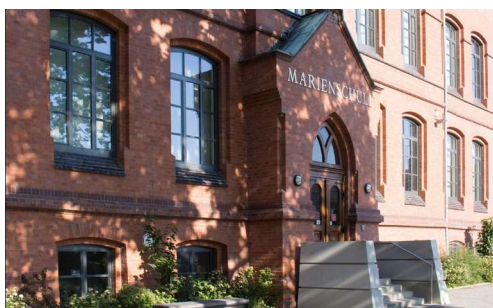
Bückeburg (Marienschule) Am Oberstenhof