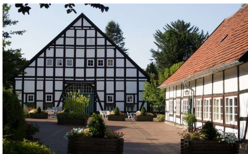
Bückeburg (Landfrauenschule) Jetenburger Straße