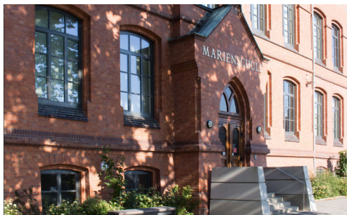
Bückeburg (Marienschule) Am Oberstenhof