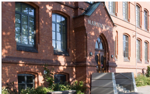
Bückeburg (Marienschule) Am Oberstenhof